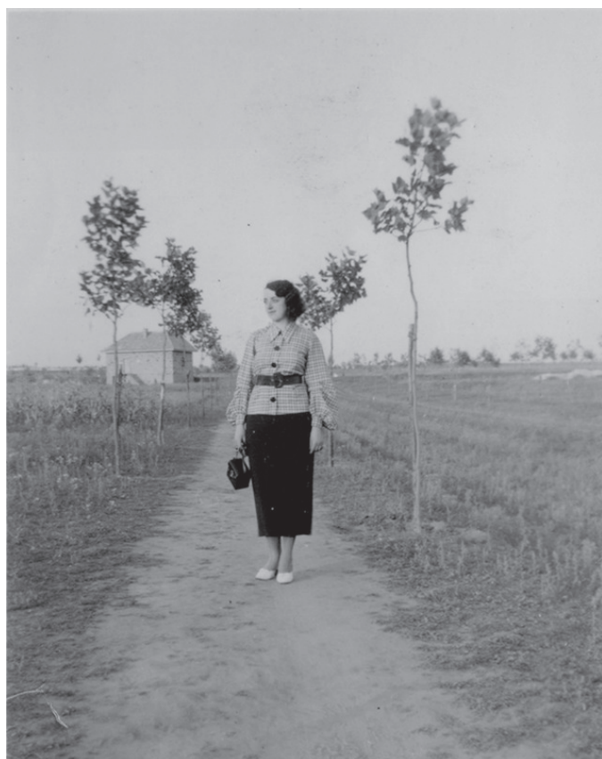
A platánsor 1936-ban

A stabilizálódó életet teljesen kizökkentették kerékvágásából az 1950-es év eseményei. Megkezdődtek az államosítások és Rákoskertet, a környék többi „Rákos” előnevelő településével együtt Budapesthez csatolták, kialakítva ezzel a főváros legnagyobb, 54,8 négyzetkilométer területű, XVII. kerületét.