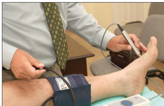
Fontos a betegség időben történő felfedezése

padt-hideg végtag, a végtag(ok) zsibbadtsága, férfiaknál szexuális zavarok, fejfájás, fülzúgás, szédülés és fáradékonyság. Az érszűkület kialakulásában kockázati tényezőt jelent a dohányzás, a cukorbetegség, a magas vérzsír- és koleszterinszint, a magas vérnyomás és a családi halmozódás (örökletes). Emellett szerepet játszik még az idős életkor, az elhízás, a mozgásszegény életmód és a stressz. A kezelőcentrumok minden önkéntes egészségpénztárral kapcsolatban állnak. (X) Kezelésekkel kapcsolatos felvilágosítás: interneten: www.medhungary.com vagy telefonon 06-70-210-1513, 06-30-265-9360, 06-20-327-6835, 06-72-551-714.